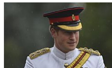
RTL Prince Harry : Buckingham palace inquiet de sa situation amoureuse et professionnelle