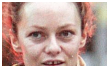
Maquillage.com Avant/Après : 30 stars avec et sans maquillage