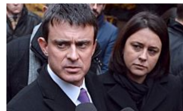
Revue Finance Nouvelle Loi Pinel: Vous avez moins de 55 ans? Investissez pour ne plus payer d'impôts