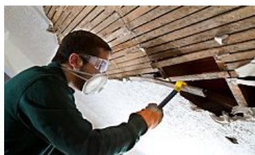
renovation-info-service.gouv.fr Découvrez les aides financières pour vos travaux de rénovation énergétique